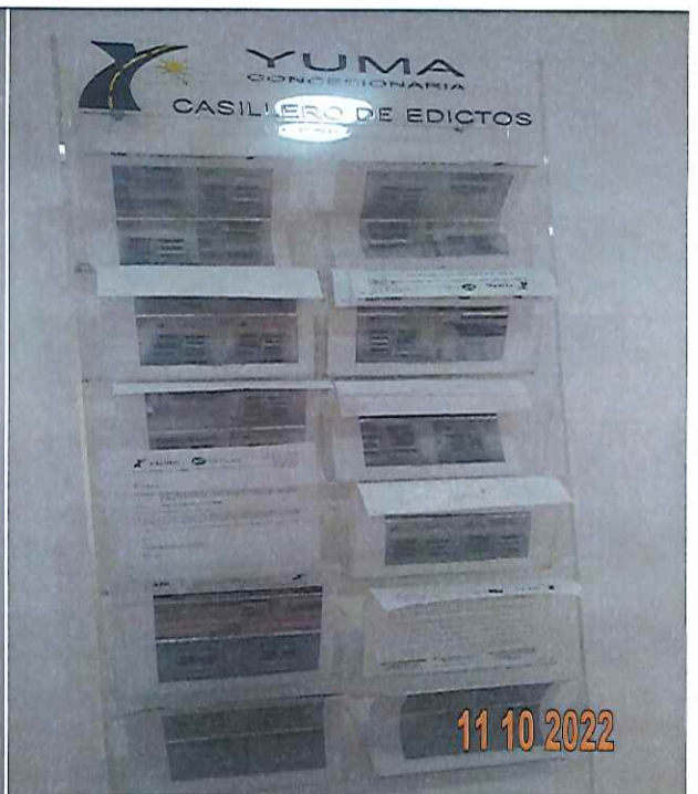
EDICTOS DE LA R_35495 YC-CRT-119816